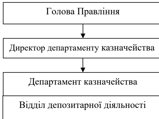
Рис.1 Організаційно-функціональна схема підрозділу Депозитарної установи, що здійснює депозитарну діяльність